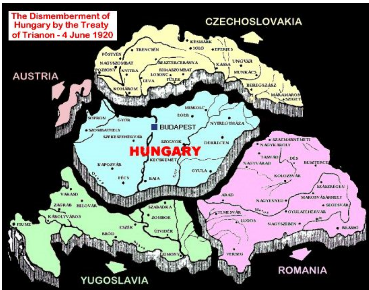
Obrázok č. 1: Rozdelenie uhorského územia podpísaním Trianonskej zmluvy