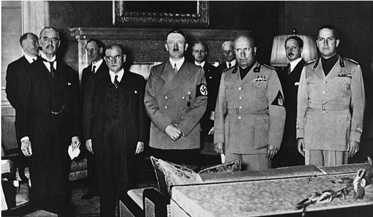
Obrázok č. 2: Predstavitelia štyroch veľmocí, ktoré podpísali Mnichovskú dohodu Zľava: N. Chamberlain, E. Daladier, A. Hitler, B. Mussolini